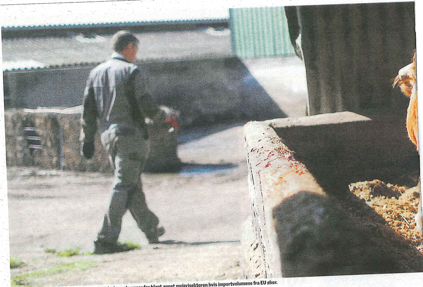
Meieriprodukter: Bondelaget frykter dramatiske konsekvenser for blant annet meierisektoren hvis importvolumene fra EU øker.