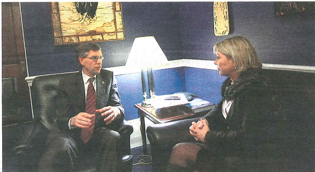
Nærings- og handelsminister Monica Mæland (H) var i forrige uke for første gang i USA, og møtte blant annet den republikanske kongressrepresentanten Erik Paulsen fra Minnesota. Paulsen, som sitter i en kongresskomité for handelsavtalen, tror landbruk, fiskeri og finans blir tøffe tema, men han er relativt optimistisk.

vekst. Men anslagene er usikre: En annen studie viser fall i norsk bruttonasjonalprodukt på 3,9 prosent.