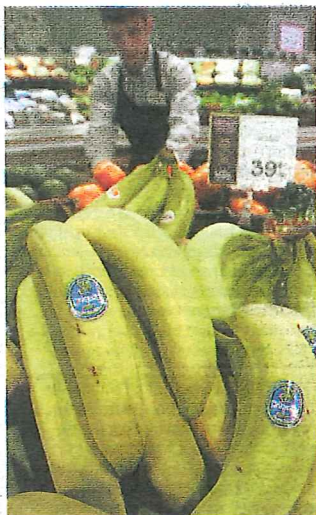
Banankrigen raste mellom EU og USA i åtte år.