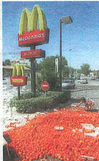
Franske bønder dumpet tomater og epler på McDonalds som svar på USAs skyhøye toll på fransk mat.